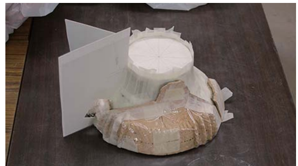
図2 実測図を参考にしての修復状況

実測図等資料を参考にして、破損部分への石コウ再充填を施した（図2）。石コウには、吉