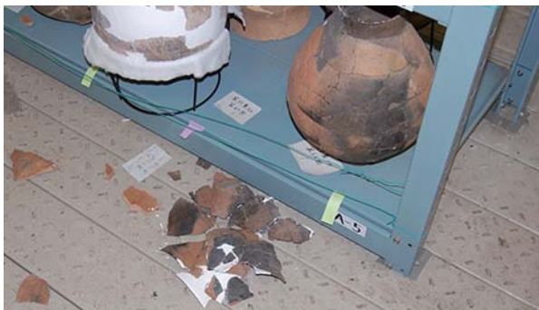
図1 東日本大震災直後の破損状況

今回、指定有形文化財として指定されるにあたり、以前よりも展示環境下での公開や運搬等の移動行為の頻度が高まると予想され、それに対応するため総合的な資料の整備作業を行うこととなった。